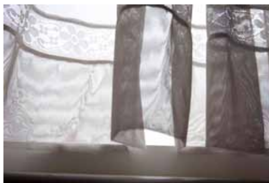
Les 3 images ci-contre : Série «Opening», 2011