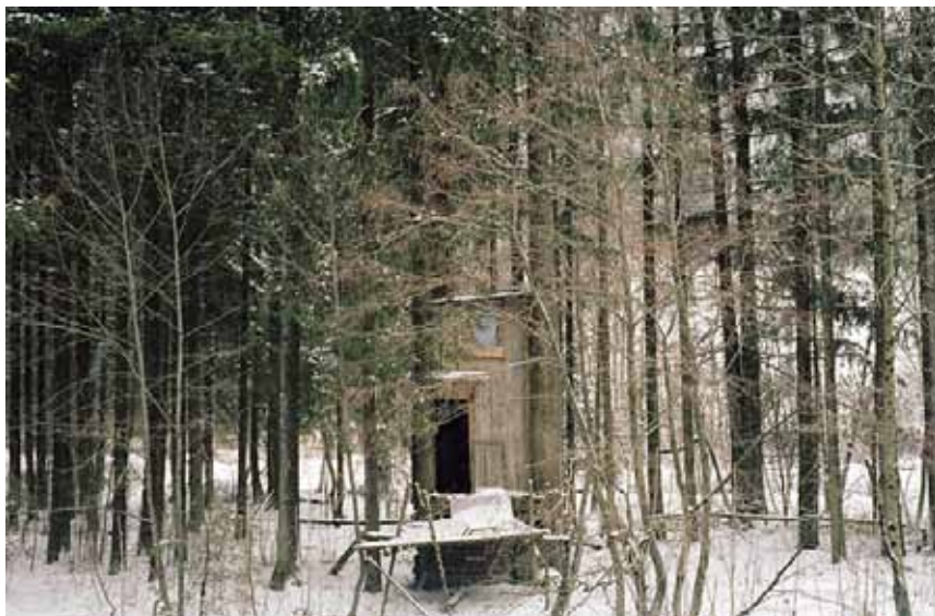
Série «Opening», 2011 © Natasha Lythgoe

Dans la proposition de Natasha Lythgoe, rien n'est défini sinon cette perception du vivant, de la nature, des vibrations infimes qui sillonnent notre monde.