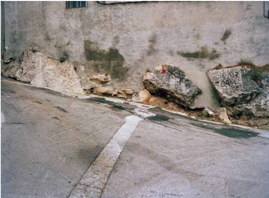
Série «Opening», 2011 © Natasha Lythgoe

Ce refus de l'image forte, cette distance par rapport à ce qui semble être la matière de telle ou telle image, s'inscrit dans un mouvement de non-représentation. Natasha Lythgoe cherche principalement la perception d'un univers, d'un état sensoriel, en lien avec la nature et les éléments qui la composent : végétaux, animaux, humains. Chaque ensemble d'images associées n'est ni définitif, ni figé dans une séquence immuable.