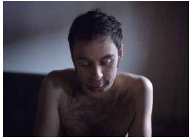
Série «Opening», 2011

Profondément sensible et sensuelle, à la fois viscéralement terrienne mais mystique, la photographie de Natasha Lythgoe s'inscrit en même temps dans une approche intellectuelle, proche de la théorie de la « déterritorialisation » de Gilles Deleuze.