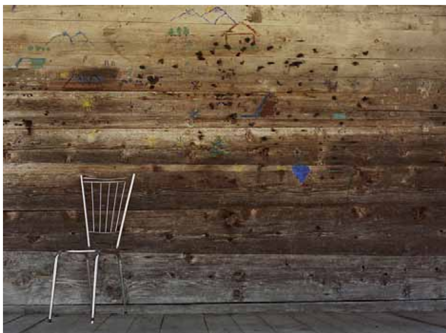
Série «Opening», 2011 © Natasha Lythgoe