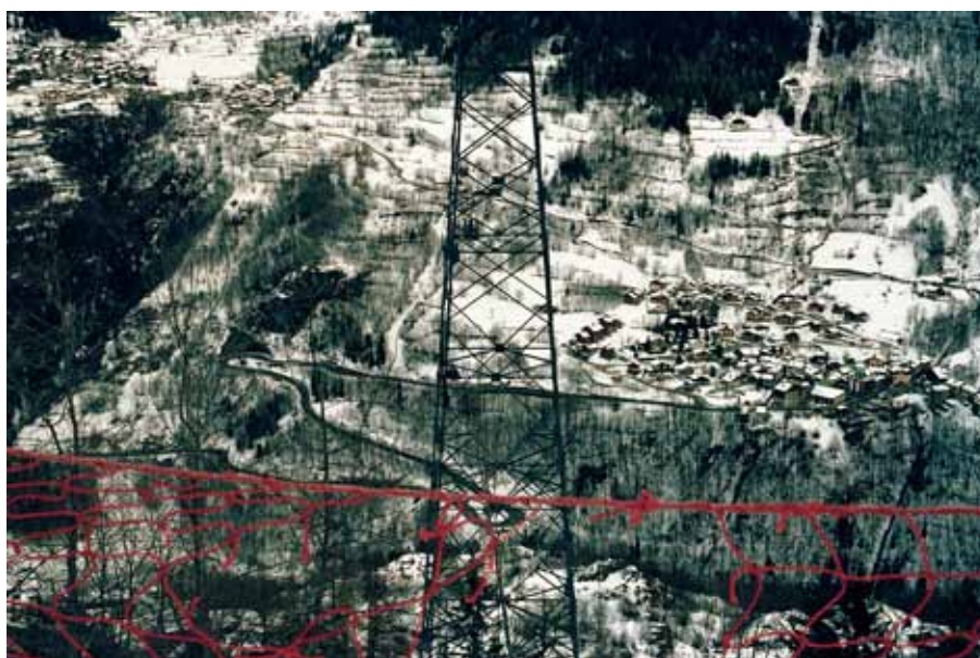
Série «Opening», 2011 © Natasha Lythgoe

Vernissage de l'exposition mercredi 13 juin 2012, de 18h30 à 21h